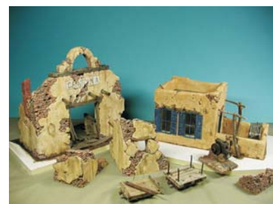
1:32 Mexiko - Gebäude