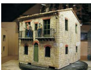
1:24 Sizilien - Dorfhaus

Zusätzlich zu den Serien-Maßstäben 1, 0, H0, N und Z wurden auch vereinzelt Kundenwünsche in anderen Zwischenmaßstäben erfüllt.