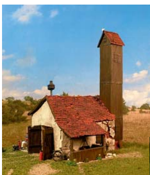
Sirenenposition frei wählbar

Alte Feuerwache / teilcoloriert* Old fire station / part-painted*