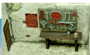
Gerätebord und Werk Tisch