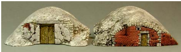
Keller 1, Vorder- und Rückseite