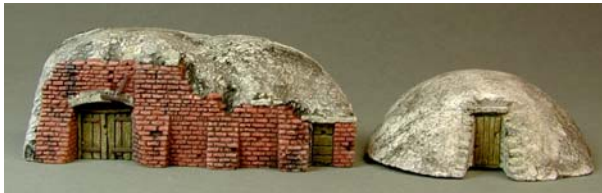
Keller 2 und 3