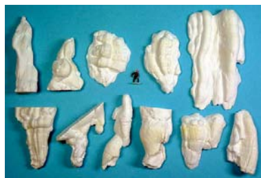
N910 Teileübersicht (ohne Figur)