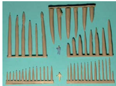
N909 Teileübersicht (ohne Figuren)