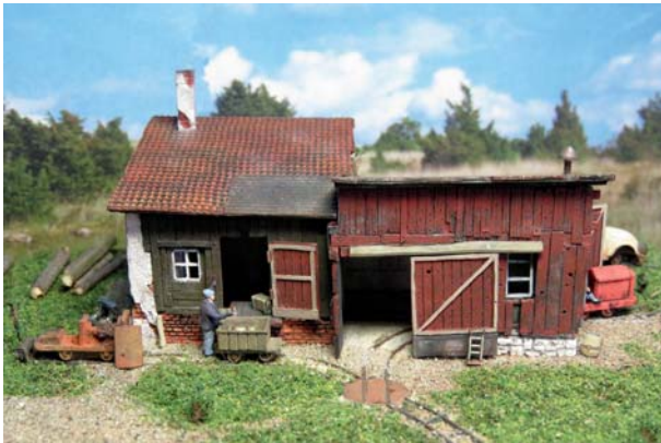
Entladung an der Rampe