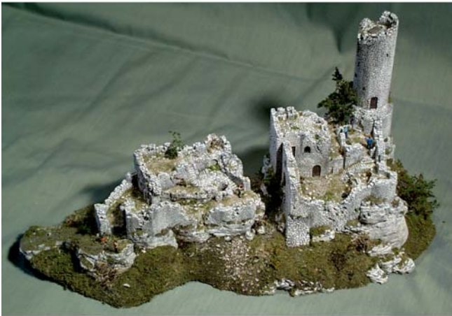
Gestaltungsbeispiel mit vergrößertem Sockel